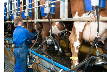
Driftsresultatet i 2014 ventes i gennemsnit at blive på 1.260.000 kr. på de større konventionelle bedrifter.

I lighed med tidligere år er spredningen stor. Ser man på bedrifterne i den bedste tredjedel, har de udsigt til særdeles pæne indtjeningsniveauer. De mindre bedrifter (både økologer og konventionelle) forventes i 2014 at opnå et gennemsnitligt driftsresultat på den gode side af 1 million. Den bedste tredjedel af bedrifterne med 240-320 årskøer forventes at kunne realisere et driftsresultat på godt 2.300.000 kr. i gennemsnit. Den gode indtjening giver bedrifterne tilhørende den bedste tredjedel mulighed for at investere og udvide produktionen, mens bedrifter med knap så gode resultater får muligheden for at afdrage på den dyre gæld.